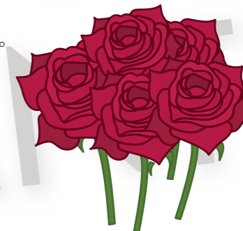
unas flores rojas