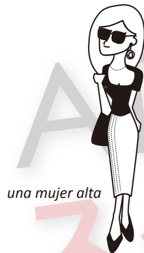
una mujer alta

Una mujer alto (男性形) ↑ ↑ 女性 (女性名詞) alta (女性形) 背の高い (形容詞)